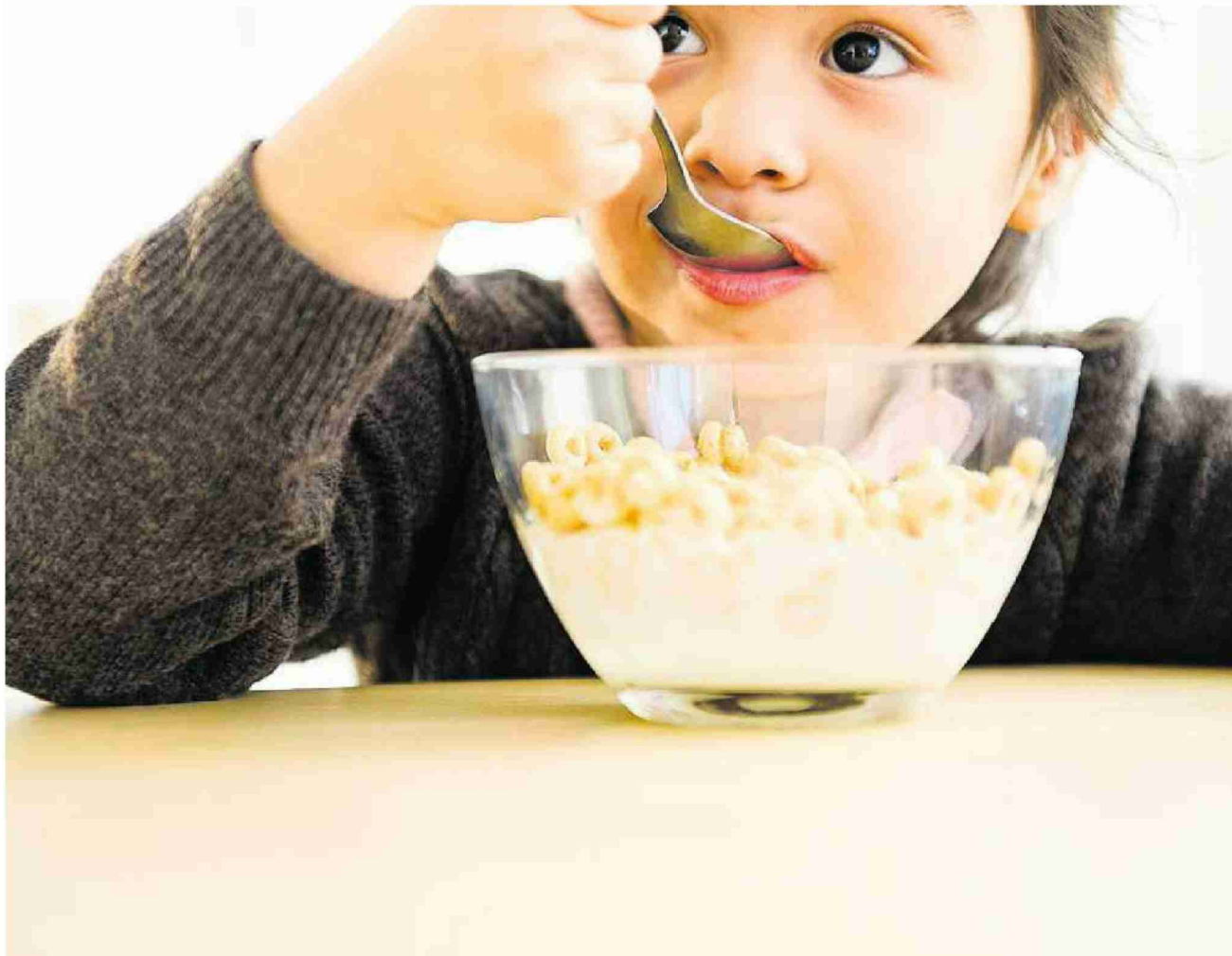
Schon mit dem morgendlichen Müesli wird oft viel zu viel Zucker gegessen.

Ernährung Das Volk konsumiert zu viel Zucker, findet der Bund. Nun tüfelt er selber an Rezepturen für weniger süsse Frühstücks-Cerealien und Joghurt – obwohl die Nahrungsmittelindustrie das Gleiche tut.