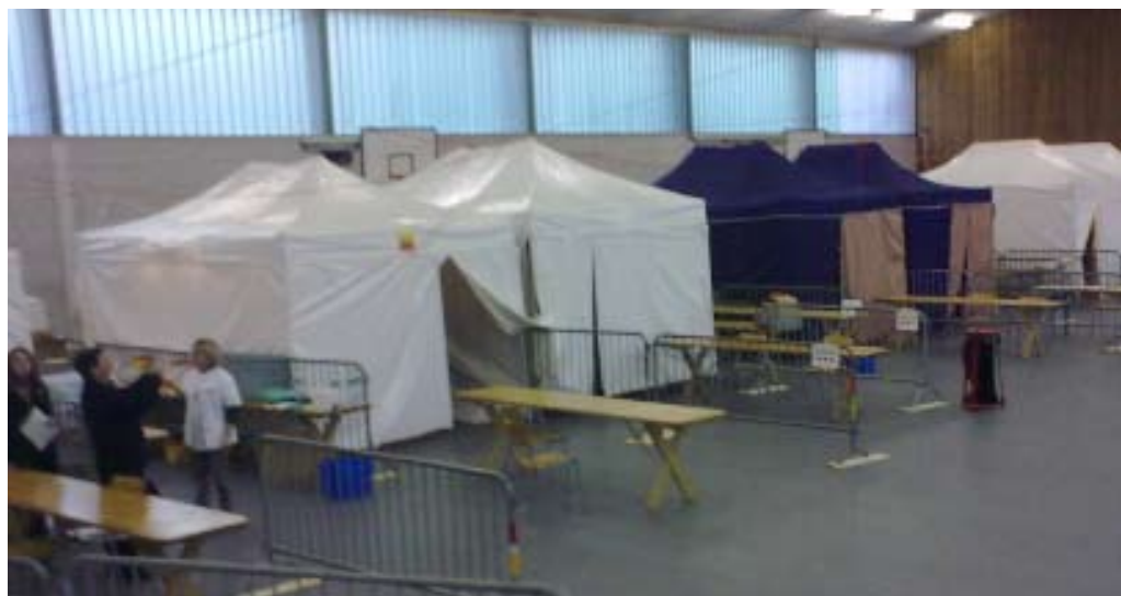
Centre de vaccination des Vernets

Les mesures d'hygiène de base demeurent d'excellents moyens, complémentaires à la vaccination, de se protéger contre la grippe et sont plus que jamais d'actualité: lavage